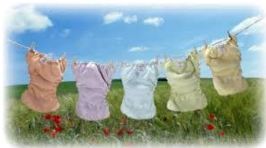
衣服 yī fu